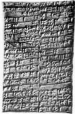
Opgave van een gerstlening uit 2048 voor onze jaartelling. De tekst is volledig ontwikkeld laat Soemerisch spijkerschrift. (British Museum, Londen)

Maar niet alleen de materiële drager van de mededeling onderging een technologische verandering. Hand in hand ermee veranderden ook de beitels, de stiften, het krijt en de pen waarmee de drager beschreven werd. Een beschrijven dat ik zie als een vorm van beschilderen. De rijkdom aan expressie en de explosie van vermenigvuldiging is direct afhankelijk van de beschikbare technische middelen. Middelen die de vorm en de inhoud sterk bepaalden. Het gaat dus ook nu nog steeds om de immer wisselende relatie tussen taal en teken, tussen betekenaar en betekenis.