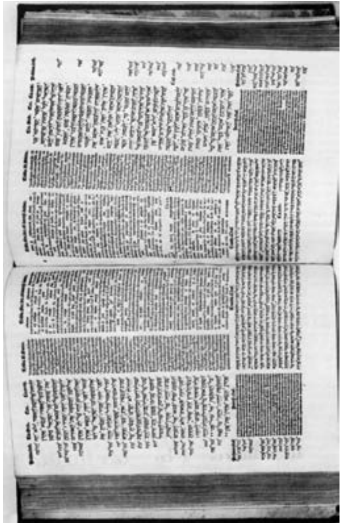
Uit de zesdelige polyglotbijbel Biblia in quatuor linguis . Het 29ste hoofdstuk van Exodus in het Hebreuws, Latijn, Grieks en Aramees. Uitgegeven tussen 1514-1517 door Alacala de Henares (Spanje). Duidelijk is dat in een elektronische omgeving, wij de diverse versies via koppelingen op ieder gewenste manier naast elkaar zouden kunnen plaatsen.